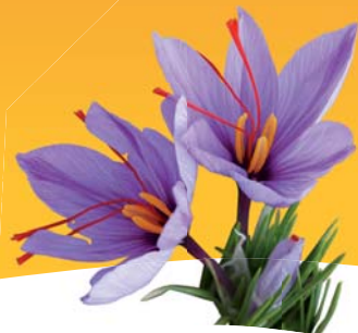
Charlène SADEGHI BOUTIQUE SAFRAN